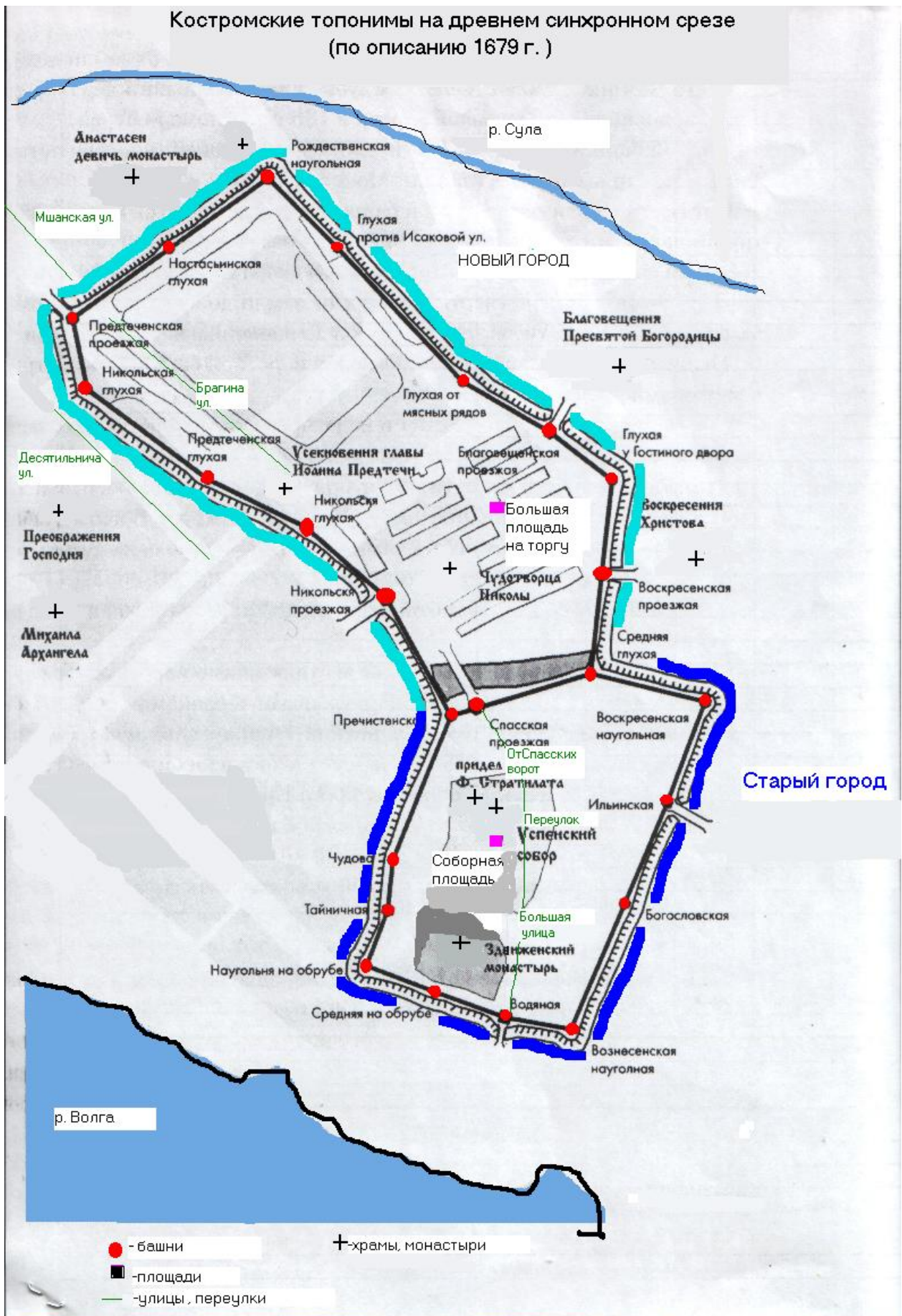
Костромские топонимы на древнем синхронном срезе (по описанию 1679 г.)